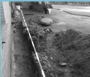
Wohnhaus in Frestedt