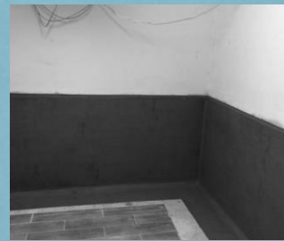
Kellerraum eines Wohnhauses