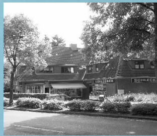
Geschäftshaus in Kiel