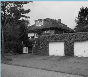
Wohnhaus in Kiel/Molfsee