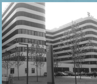
Bürogebäude mit Tiefgarage in Hamburg