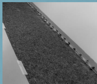
Keller eines Neubaus in Elmshorn