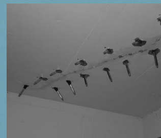
Kellerdecke in Kiel