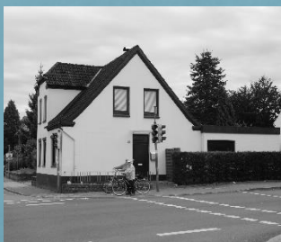
Wohnhaus in Schleswig