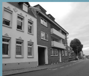
Wohnhaus in Schleswig