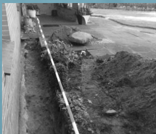
Wohnhaus in Frestedt