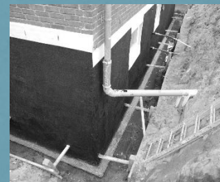
Einfamilienhaus in Neumünster